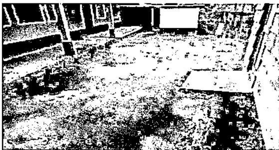
Foto 5: Sustitución de Torta de Cemento de 8 centímetros de espesor