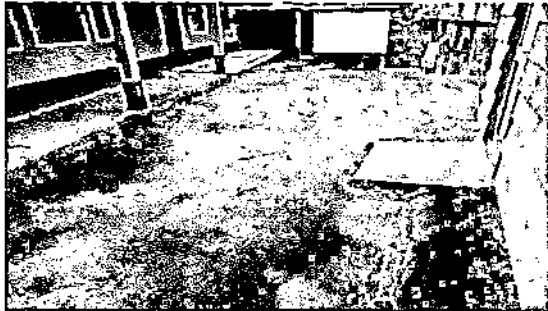
Foto 1: Sustitución de Torta de Cemento de 8 centímetros de espesor